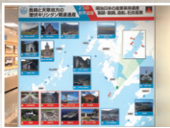
世界文化遺産維持保全事業への支援(寄付)

長崎県の世界文化遺産「長崎と天草地方の潜伏キリシタン関連遺産」の維持保全事業として寄付活動や、青少年育成の為、ジュニアサッカー大会、ミニバスケットボール大会を実施しています。