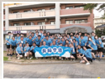
地域イベントへの参加