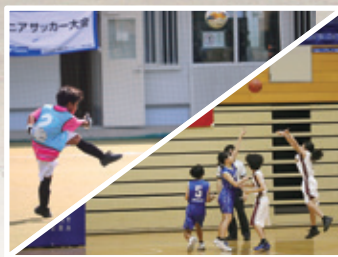
NABIC CUPサッカー大会 ミニバスケットボール大会